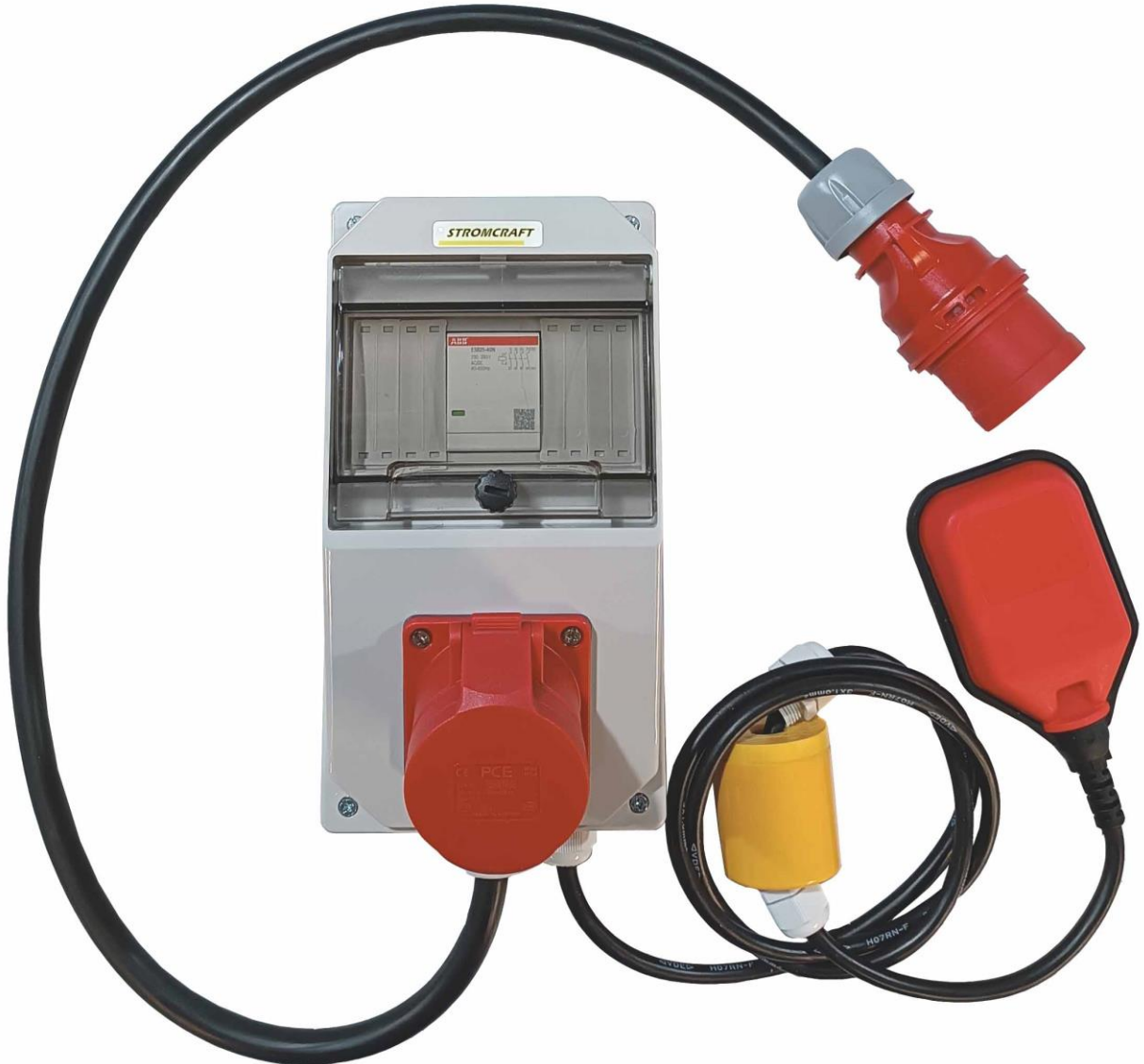
Schaltgerätekombination " Pumpensteuerung Drehstrom"

Drehstrom Pumpensteuerung (Kraftstrom, Starkstrom, Baustrom) CEE 16A (400V)